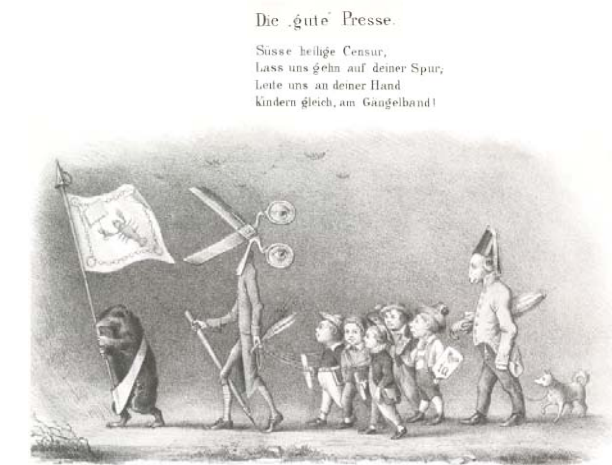
Die gute Presse, Lithographie von unbekannter Hand, 1847

Die Geschichte von Zensur und Pressefreiheit steht überall in der Welt im Zentrum der Demokratiegeschichte. Mit der Entfaltung der periodischen Presse erhielten die Zensurbehörden eine neue Aufgabe von solcher Brisanz, dass es erforderlich wurde, die Aufsicht über die Zeitungen von der Bücherzensur zu trennen. Die Kontrolle der „gefährlichen“ politischen Tagespresse wurde in der Regel ungleich strenger als die Bücherzensur ausgeübt, so etwa – entgegen einer Legende – im friederzianischen Preußen. Damit ist angedeutet, dass das Museum beim Nachzeichnen des langen Weges von der Bedrückung zur Befreiung des gedruckten Wortes manche Überraschung bereithält. Den Besuchern erwarten viele unbekannt Zeugnisse des Aufbegehrens gegen die staatliche Bevormundung aus der Zeit Metternichs und Bismarcks, dem Kaiserreich und den Diktaturen des 20. Jahrhunderts, die Thomas Manns Verdikt, von der „unpolitischen Natur der Deutschen“ in Frage stellen können. Auf viele dunkle Kapitel folgt mit der friedlichen Revolution vom Herbst 1989, in der die Pressefreiheit in Ostdeutschland auf der Straße erkämpft wurde, ein optimistischer Schluss.