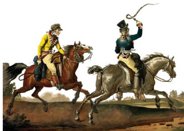
Die Postreiter, Reproduktion nach einer kolorierten Aquatinta von Carle Vernet, um 1800

Die Zeitung – nach der Definition ein periodisch erscheinendes Druckerzeugnis mit aktuellem und universalem Inhalt, das sich an jedermann wendet – kann nur existieren, wenn der regelmäßige Bezug von Nachrichten gewährleistet ist. Dies konnte allein die Post verbürgen, die deshalb mit Recht als „Mutter der Zeitung“ bezeichnet wird. Bis weit ins 19. Jahrhundert hinein bestimmte ihr überlegenes System der Reiterstaffette, das zunehmend das uneffiziente Botenwesen verdrängte, die Geschwindigkeit des Briefverkehrs und damit die Aktualität der Berichterstattung. Die Post behielt auch organisatorisch die Federführung als das Nachrichtenwesen im Industriezeitalter eine rasante technische Entwicklung durchlief. Sie nutzte zum Brieftransport die Eisenbahn und unterhielt das Netz für Telegraph, Telefon und Fernschreiber – Erfindungen, die fast ohne Zeitverlust die Nachrichten zum Redakteur trugen. Das Museum wird den langen Weges vom Postreiter bis zum Nachrichtensatelliten mit einem reichen authentischen Material nachzeichnen und insbesondere die technische Entwicklung seit der Mitte des 19. mit funktionsfähigen Originalgeräten dokumentieren.