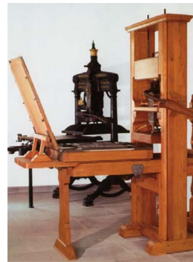
Hölzerne Zeitungs-Authentischer Nachbau der Presse, auf der amerikanische Buchdrucker und Staatsmann Benjamin Franklin 1725 Zeitungen druckte. Nach dem Original der Smithsonian Institution, Washington.

Für den Buch- und Zeitungsdruck wurden lange Zeit hölzerne Handpressen von gleicher Konstruktion genutzt. Die Arbeitsabläufe beider Produktionszweige unterschieden sich jedoch beträchtlich. Während Satz und Druck von Büchern hohen ästhetischen Ansprüchen genügen sollten, kam es bei der Zeitungsproduktion vornehmlich auf schnelle Fertigung an, um das Aktualitätsbedürfnis der Leser zu bedienen. Die Vorgabe, große Auflagen in kurzer Zeit auszudrucken, zwang dazu, die Leistungsfähigkeit der Pressen zu verbessern. Nicht von ungefähr sind alle wesentlichen Innovationen im Druckpressenbau von der Zeitung ausgegangen: die Kniehebelpresse, die mechanische Schnellpresse, die Hochdruck-Rotation und die Rollenoffsetpresse. Auch die Entwicklung der Setzmaschine in Gestalt der berühmten „Linotype“ ist vom Aktualitätsdruck der Zeitungsproduktion beflügelt worden. Die Zeitung trug wesentlich dazu bei, das aus weißen Lumpen (Hadern) gewonnene Papier zu verknappen. Erst die Erfindung des Holzschliffpapiers beseitigte diesen Mangel. Die Presse, auf der 1845 unser modernes Papier erstmals praktisch erprobt wurde, ist neben anderen „Reliquien“ der Druckgeschichte in unserem Museum Ausstellung im Original zu sehen – eine Ikone der Kulturgeschichte.