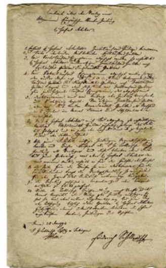
Contract über den Verlag einer Allgemeinen Europäischen Staaten Zeitung von Hr. Hofrat Schiller

Noch lange nach dem Entstehen der Zeitung waren die Funktionen des Verlegers, Redakteurs und mitunter auch des Druckers in einer Person vereinigt. In der harten Konkurrenz, die sich im deutschen Sprachgebiet früher und stärker als andernorts ausbildete, konnten die Zeitungsunternehmen nur mit hoher journalistischer Qualität reüssieren. Das erforderte „vigilante“ politische Köpfe, die ganz im Redakteursberuf aufgingen. Ausgerechnet die besten unter ihnen, die ihren Blättern markante Profile gaben, sind heute vergessen; sie sollen im Museum wieder ins Licht gerückt werden. Die Revolution der Nachrichten- und Drucktechnik in der zweiten Hälfte des 19. Jahrhunderts veränderten nachhaltig die Gestalt der Zeitung und mit ihr auch die Struktur der Redaktionen. Neue Ressorts entstanden, vom Feuilleton bis zur Wirtschaft und vom Lokalen bis zum Sport, und mit dem Bild in der Zeitung auch die neuen Berufe des Pressezeichners und Fotojournalisten. Das Museum wird diese Entwicklungslinie bis in die Gegenwart ziehen: Es wird angestrebt, einen realen Arbeitsplatz eines Redakteurs zu integrieren, um es den Besuchern zu ermöglichen, das Entstehen ihrer Zeitung von morgen zu erleben.